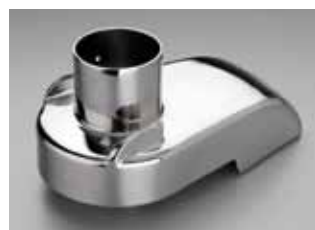
Deckel aus hochglanzpoliertem Edelstahl mit grossem 80 mm Rundschaft, für hohe Leistung.

Deckel, Saftauffangbehälter, Schleuderkorb und Reisscheibe sind aus rostfreiem Edelstahl, d.h. waschmaschinenfest. Die Reisscheibe ist im Schleuderkorb eingeschraubt und lässt sich bei Abnutzung leicht auswechseln.