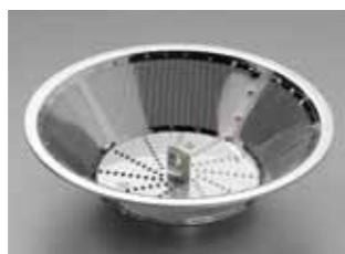
Robuster Schleuderkorb, komplett aus Edelstahl.